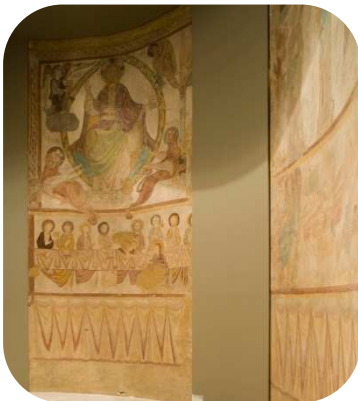
SAINT-JACQUES-DES-GUÉRETS (Loir-et-Cher), ÉGLISE SAINT-JACQUES-LE-MAJEUR Christ en gloire, XII e siècle