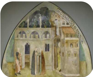
ABONDANCE (Haute-Savoie), ANCIENNE EGLISE ABBATIALE NOTRE-DAME Galerie sud du cloître La Visitation, vers 1430