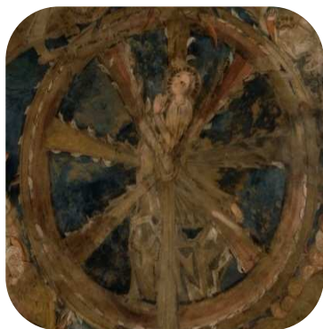
LE PUY-EN-VELAY (Haute-Loire), CATHÉDRALE NOTRE-DAME

Modèles de vie pour les chrétiens et intercesseurs, les saints reçoivent un culte de plus en plus important au cours du Moyen Âge, qui connaît son apogée au XV e siècle. La " Légende dorée " (1261-1266), de Jacques de Voragine (1230-1298), popularise les récits de leurs vies et martyrs. Les cryptes et les chapelles se couvrent de peintures reprenant ces thèmes.