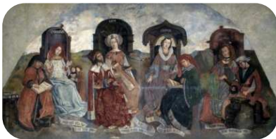
LE PUY-EN-VELAY (Haute-Loire), CATHÉDRALE NOTRE-DAME Librairie du chapitre Arts Libéraux 1475