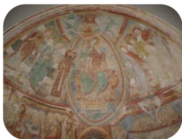
MONTMORILLON (Vienne) ÉGLISE NOTRE-DAME

Chapelle basse, abside Vierge à l'Enfant accompagnée de saintes, début du XIII e siècle