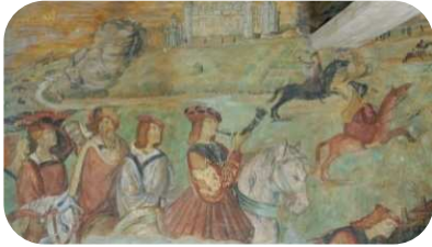
ROCHECHOUART (Haute-Vienne), CHÂTEAU DE ROCHECHOUART, Premier étage de l'aile nord La chasse aux cerfs, début du XVI e siècle