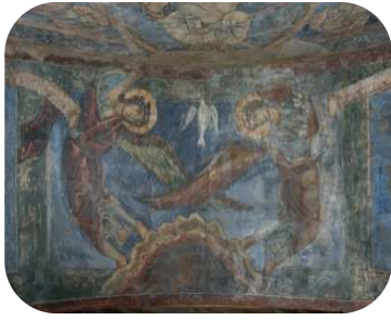
LE PUY-EN-VELAY (Haute-Loire) Mur sud du porche occidental Ange, Détail de la Transfiguration, début du XIII e siècle